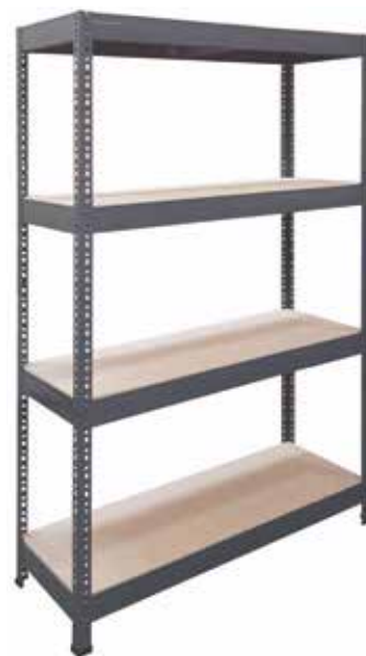
84,95€ ESTANTERÍA METAL MADERA SUPER LINE 4 baldas MDF. Sin tornillos. Máx. 500 kg x balda. Acabado galvanizado. Med.: 180x120x45 cm.