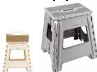
14,95€ TABURETE PLEGABLE ARREGUI Peso máximo: 150 kg. Med. abierto: 39x29x22 cm. Acabado beige o gris.