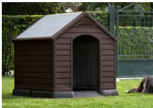
89,95€ CASETA PERRO Con suelo elevado, sistema de ventilación, sin uniones en techo. Med.: 95x95x99 cm.