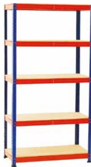
79,95€ ESTANTERÍA METAL MADERA 5 baldas MDF. Sin tornillos. Máx. 200 kg x balda. Acabado azul/naranja. Med.: 197x100x50 cm.