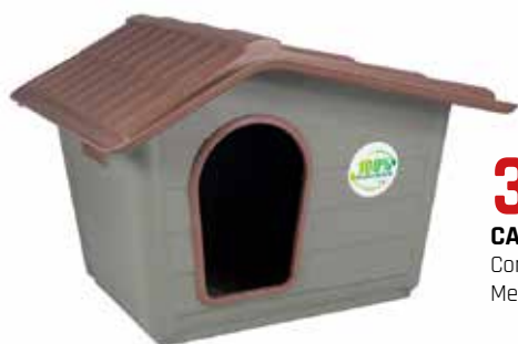
37,95€ CASETA PERRO Con doble rejilla de ventilación. Med.: 60x50x41 cm.