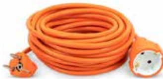
19,95€ PROLONGADOR SUCKO Max. 3680W. Longitud 10 m.