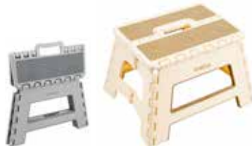
8,95€ TABURETE PLEGABLE ARREGUI Peso máxima: 150 kg. Med. abierto: 22x29x22 cm. Acabado beige o gris.