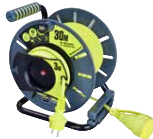
57,95€ ENROLLACABLES JARDÍN Max 3680W .IP 44. Longitud 30+3 m.