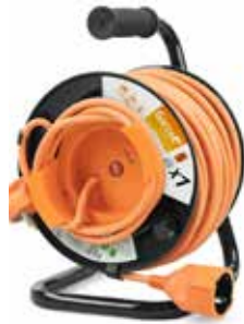
49,95€ ENROLLACABLES JARDÍN Max. 3500W. Longitud 25 m.