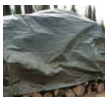
5,25 € TOLDO REFORZADO Med.: 3x2 m. 120 g/m 2 . Acabado verde. (También disponible Med.: 3x4 cm. PVP: 10,95€ Med.: 3x5 cm. PVP: 12,95€ )