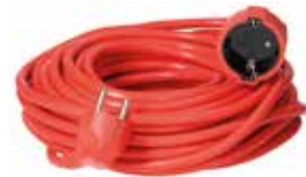
24,95€ PROLONGADOR SUCKO Max. 3500W. Longitud: 15 m.