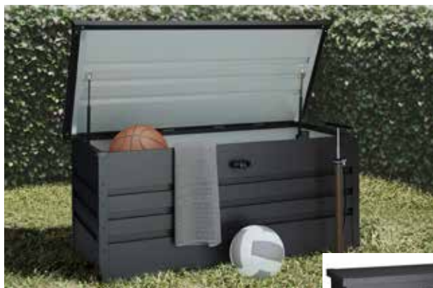
169€ ARCÓN METÁLICO 450 L Incluye cierre de seguridad con llave y dos amortiguadores. Med.: 112x62x61 cm.