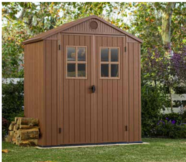
479 € CASETA DARWIN 6X4 2,2 M 2 Paneles doble capa de Evotech™. Techo a dos aguas. Puertas abatibles. Med.: 190x221x122 cm.