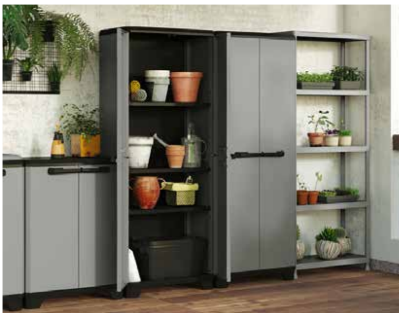
69,95€ ARMARIO PLANET 3 baldas. Acabado gris/negro. Med.: 173x68x39 cm. 74,95€ ARMARIO PLANET ESCOBERO Acabado gris/negro. Med.: 173x68x39 cm.