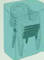
7,95 € FUNDA SILLAS Med.: 68x68x110 cm.