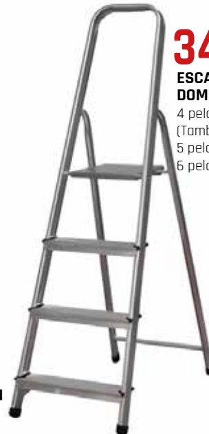
34,95€ ESCALERA DOMÉSTICA ALUMINIO 4 peldaños. (También disponible 5 peldaños. PVP: 39,95€ 6 peldaños. PVP: 49,95€)