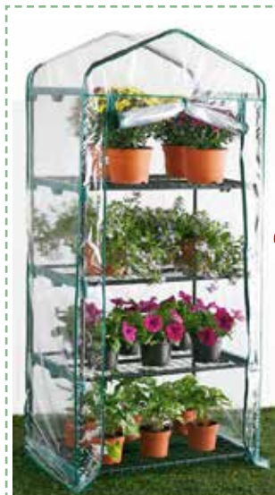
49,95 € INVERNADERO 4 estantes. Med.: 158x69x49 cm.