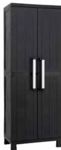
79,95€ ARMARIO GARAGE MIDEI 4 baldas. Acabado negro. Med.: 173x65x37 cm.