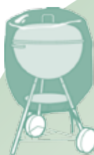
6,95 € FUNDA BARBACOAS Med.: Ø73x60 cm. (También disponible Med.: 58x103x58 cm. PVP: 7,95€ )

RECUERDA PROTEGER TUS MUEBLES DE EXTERIOR CON FUNDAS. RESGUARDARLAS DEL POLVO, LA LLUVIA Y OTRAS INCLEMENCIAS METEOROLÓGICAS.