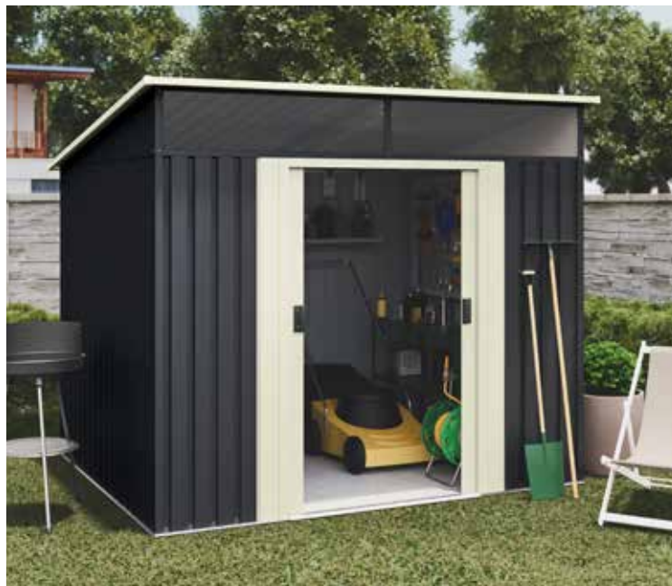
369 € CASETA METAL GANSEN II 4,6 M 2 Chapa galvanizada de 0,25 mm. de espesor. Techo a un agua. Puertas correderas. Med.: 239x203x193 cm. Acabado gris/beige.