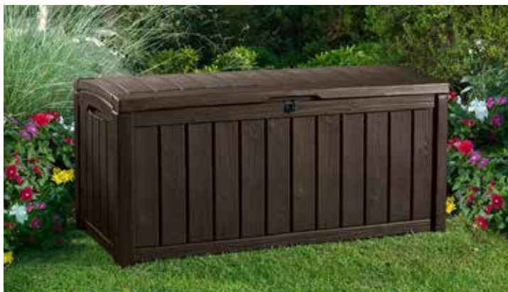
149€ ARCÓN GLENWOOD KETER 390 L Resina imitación madera. Med.: 128x65x61 cm.