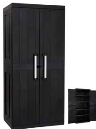
149,95€ ARMARIO GARAGE MEGA 4 baldas. Tiradores de aluminio. Acabado negro. Med.: 190x89x54 cm.