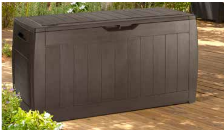
42,95€ ARCÓN HOLLYWOOD KETER 270 L Resina imitación madera. Med.: 117x45x57,5 cm.