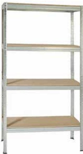
35,95€ ESTANTERÍA METAL MADERA 4 baldas MDF. Sin tornillos. Máx. 200 kg x balda. Acabado galvanizado. Med.: 177x90x40 cm.