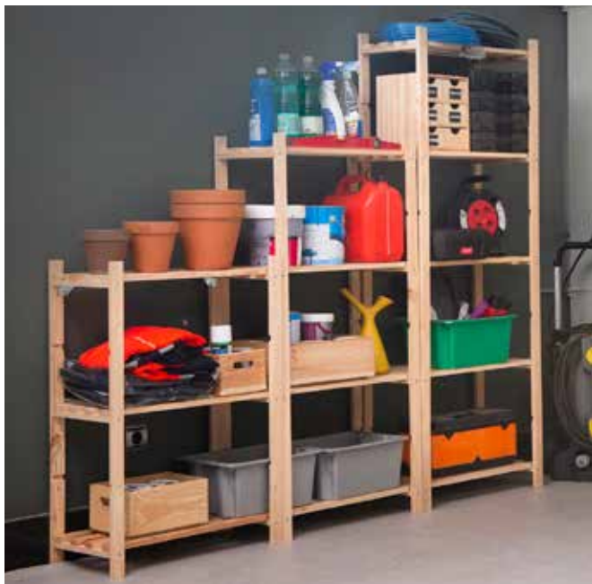
13,95€ ESTANTERÍA ALISTONADA NATURA 3 baldas. 40 kg./balda. Pino macizo sin barnizar. Med.: 88x65x30 cm. (También disponible 4 baldas, Med.: 131,5x65x30 cm. PVP: 18,95€ 5 baldas, Med.: 171x65x30 cm. PVP: 22,95€ )