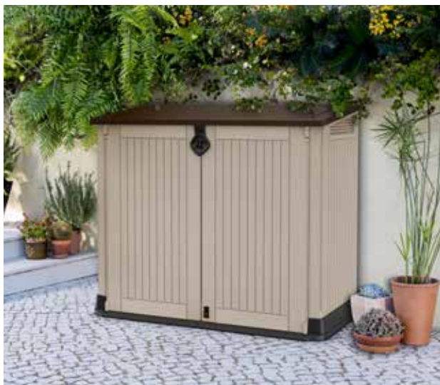
169€ COBERTIZO SIO MIDI KETER 880L Resina imitación madera. Suelo inclinado que facilita la entrada o salida. Med.: 132x71,5x113,5 cm.