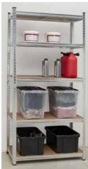
34,95€ ESTANTERÍA METAL MADERA KREATOR 5 baldas MDF. Sin tornillos. Máx. 175 kg x balda. Acabado galvanizado. Med.: 180x90x40 cm.