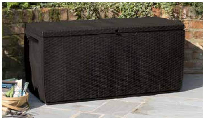
74,95€ ARCÓN CAPRI KETER 305 L Resina imitación ratán. Med.: 123x53,5x57 cm.