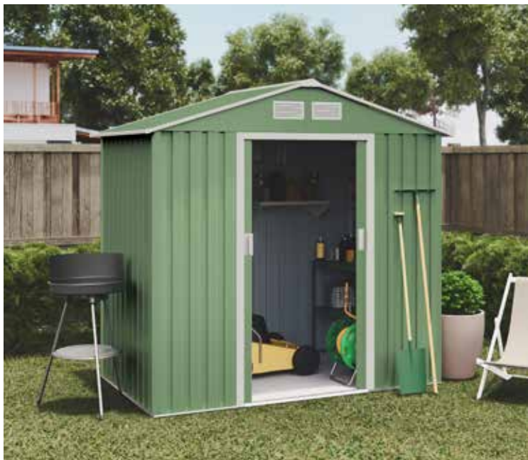
239 € CASETA METAL VISBY MINT 2,57 M 2 Chapa galvanizada de 0,25 mm. de espesor. Techo a dos aguas. Puertas correderas. Med.: 196x196x131 cm. Acabado verde.