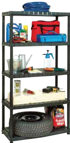
49,95€ ESTANTERÍA RESINA 5 baldas. Máx. 70 kg x balda. Acabado negro. Med.: 185x92,5x46 cm.