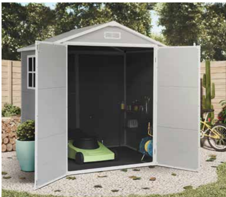
399 € CASETA RESINA SPACE PLUS ONE 2,39 M 2 Paneles doble capa de PVC. Techo a dos aguas. Puertas abatibles. Med.: 181x210x134 cm. Acabado gris/blanco.