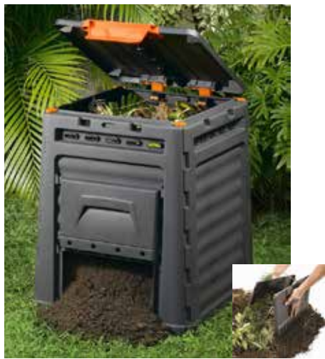
44,95€ COMPOSTADOR ECO KETER 320L Med.: 65x65x75 cm.