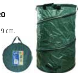
10,95 € SACO RECOGE HOJAS EXTENSIBLE 110L Med.: Ø48x60 cm.